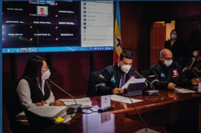
COMITÉ DE MANEJO Art. 20