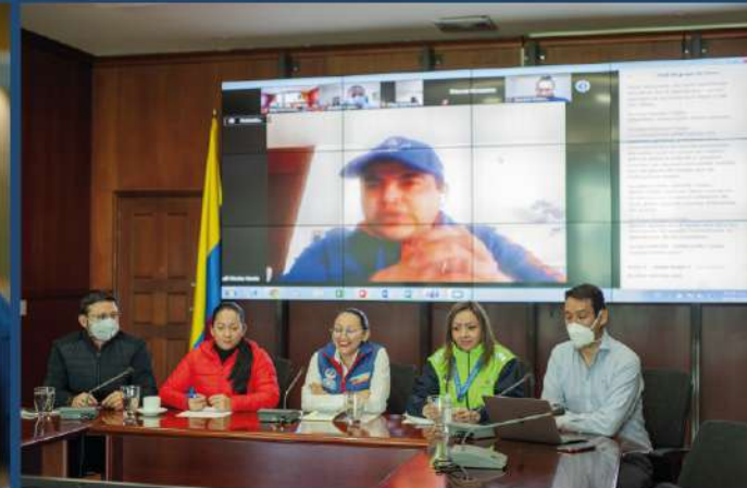
PUERTO DE MANDO UNIFICADO (PMU)