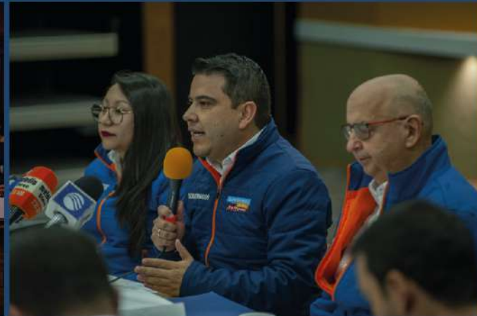
CONSEJO DEPARTAMENTAL PARA GESTIÓN DEL RIESGO Art. 17