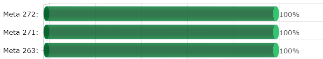
Gráfica Por Eficacia