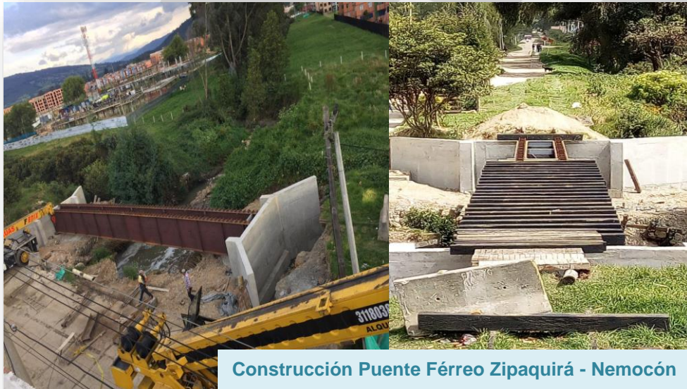
Construcción Puente Férreo Zipaquirá - Nemocón

ODS vinculado: ODS 8. Trabajo decente y crecimiento económico.